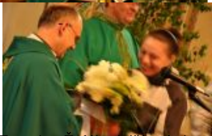
další snímky v galerii