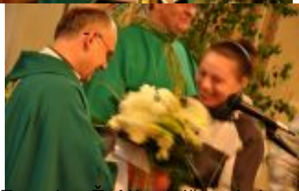
další snímky v galerii